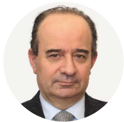
Franco Anelli Rettore dell'Università Cattolica del Sacro Cuore