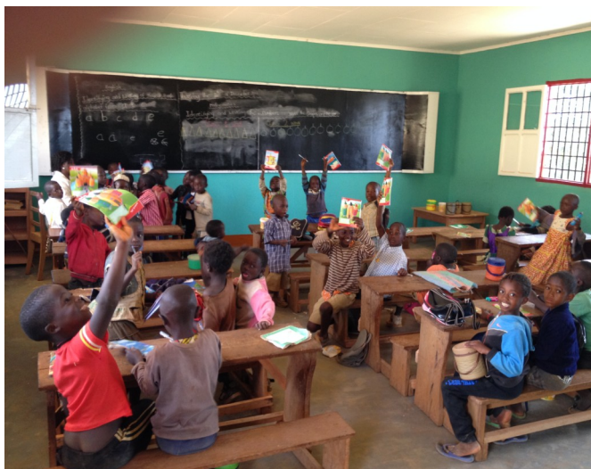
I bambini di Scolasticat St Hannibal Marie Di Francia NGOYA - Cameroun