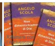
Non dimentichiamo di Dio