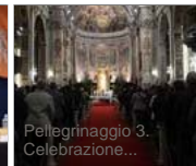
Pellegrinaggio 3. Celebrazione...