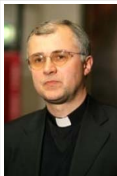
Monsignor Claudio Giuliodori

9.04.2013 «Una consolidata tradizione» che costituisce «un passaggio fondamentale della vita dell'Università e del suo essere espressione qualificata e dinamica dell'impegno educativo e culturale dei cattolici nel nostro Paese». Monsignor Claudio Giuliodori, assistente ecclesiastico generale dell'Università Cattolica, parla in questi termini della Giornata nazionale per l'Ateneo del Sacro Cuore, che si celebra domenica 14 aprile. Istituito ufficialmente nel 1924, a partire dall'edizione del 1968 si è deciso di sottolineare con un tema specifico l'evento, accompagnato da un messaggio della presidenza della Cei. «Con le nuove generazioni oltre la crisi» è il tema dell'edizione 2013 (testo integrale del messaggio). Alla Cattolica (cinque sedi, 54 Istituti, 22 Dipartimenti, 70 Centri di ricerca, 5 Centri di Ateneo, 151 strutture dedicate alla ricerca scientifica) sono attualmente iscritti 40.970 studenti, 1.525 i docenti in organico.