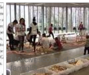
...altre photogallery »