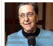
Cattolica, un servizio prezioso...