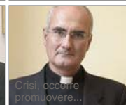
Crisi, occorre promuovere...