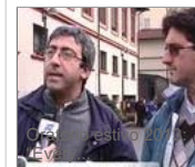
Crisi, occorre promuovere...