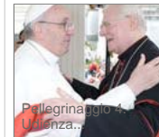
Pellegrinaggio 4. Udienza...