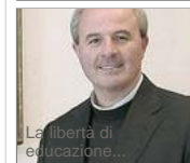
La libertà di educazione...