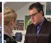
...altre videogallery »