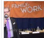
Family at work (120)